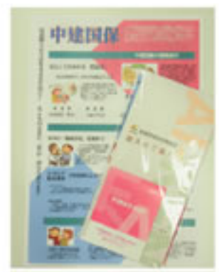
事業所設置のパンフ(上)と名入りボールペン(下)

〔長山 文子・松山・書 した。〕松山支部では、例年8月に役員が組合パンフ設置事業所25か所を訪問し、パンフレットの差し替えを兼ねて、未加入者の紹介をお願いしてまいりました。しかし、コロナウイルス感染拡大もあり、今年は事業所へ郵送でパンフレットを送り差替えてもできませんでした。また、組織拡大月間の