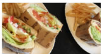
地元食材使った新鮮なサンドイッチ

元々あった押入れを活用し、階段を取り付けたり、子供が動き回れりたり積み木や絵本など子供も長時間飽きずに遊べます。