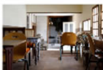
落ち着いた雰囲気の家具

東温市の面河と河之内方面を結ぶ重要な物資物流のルートであった黒森街道。Kurumori は人々の往来により栄えた宿場町の酒屋をリノベーションし、スタートしました。外観の白い壁はモルタルと白い塗料が使用され、窓枠の壁をわざと分厚くし奥行きを持たせヨーロッパの石津栗の建物を思わせます。窓枠やドア、鉄格子のアイアンなどはフランスのアンティークで元の建物とマッチしている。 カフェでは河之内産の食材を使用したハヤシライスやスイーツが提供されます。運営しているのは地域運営組織「美しい里山河之内」のメンバーでその他にも空き家となった古民家をリノベーションし、花屋や自転車屋をスタートさせ情報発信をしています。 自転車の販売・修理だけではなく地区の山道を整理してトレイルライドコースを設置し運営しています。