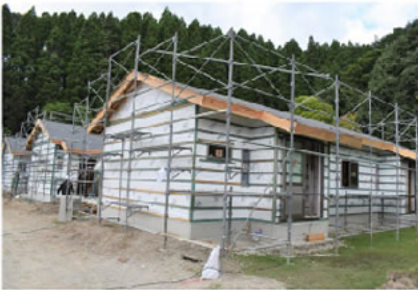
愛媛建労9人と500人超の全国の仲間が協力した仮設木造住宅

九州豪雨災害（令和2年7月豪雨）で、熊本県を中心に大きな被害にあわれた被災者のための応急仮設住宅の建設を「全国木造建設業協会」（以下、全木協）が受注して、全建連連の全国の仲間が就労している仮設住宅の建設工事ですが、10月16日に17戸の団地が着手され、合計で612戸となりました。 これで、2016年の熊本地震での563戸、2011年の東日本大震災での584戸を上回り、過去最大戸数となりました。全国からの就労者は500人（愛媛建労9人）を超えて9月末まで