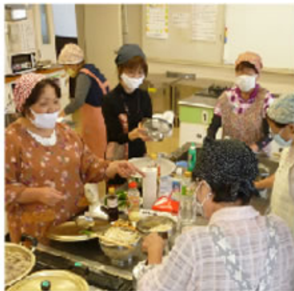
料理教室で協力して秋の味覚メニューを作る

※国税庁ホームページ(新型コロナウイルス感染症に関連する税務上の取扱い関係)より抜粋