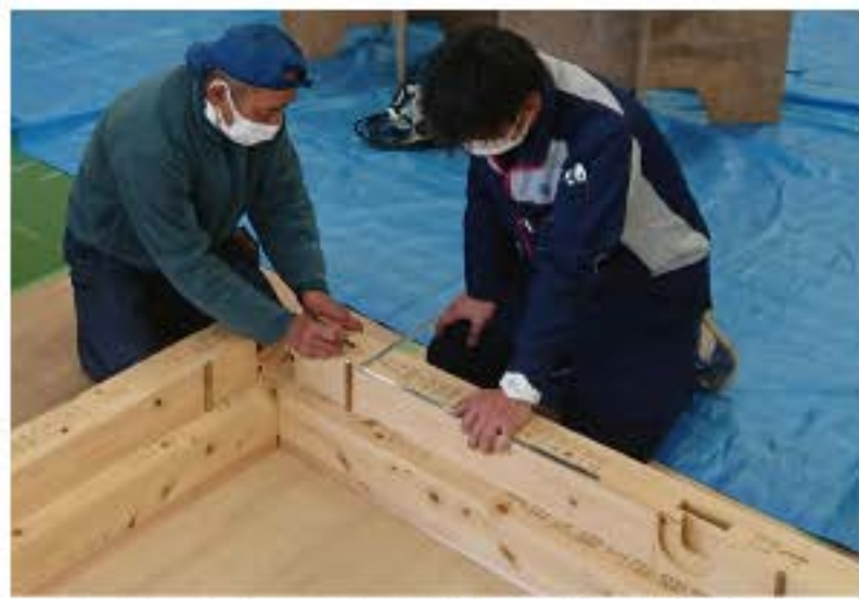
プレカット構造材を用いた木造軸組住宅の基礎を学ぶ受講生

組合員数の動向 加入者 33人 脱退者 34人 前月比 ▲1人 1月末現在 5,603人