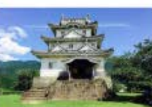
安定感のある塔風の形態

宇和島城が宇和島市の現在の地に初めて天守が建造されたのは1601年とされています。