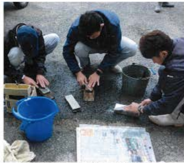
会館清掃と合わせて持参された包丁を研ぐ

※通常、運用利回りが見直しされる5年間で比較すると、掛金10円の引き上げにより、年間で2,520円の掛け金負担増となりますが、退職金額も引き上げが見込まれています。