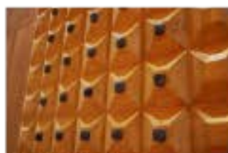
和釘を使ったアート

公衆浴場として初めて国の重要文化財に指定された道後温泉本館の別館として2017年に椿の湯の隣に飛鳥乃湯泉が誕生しました。名前の通り飛鳥時代をイメージした建築様式を取り入れた建物と砥部焼など愛媛の伝統工芸を使ったアートを同時に堪能できる温泉施設となっています。浴槽内の背景は幅5・4尺、高さ2・7尺の巨大な砥部焼の陶板壁面となっており、山と海をテーマに描か