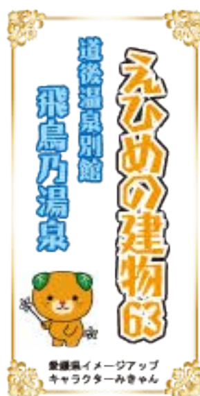
飛鳥時代をイメージした建築様式