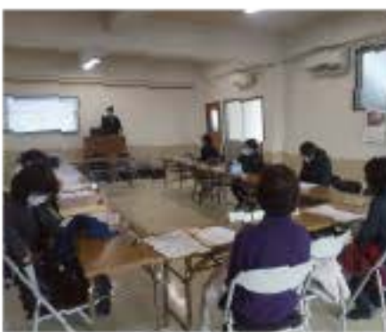
座席間隔を空けて学習会を行う

〔合田 英武・全薪居 派・労対部長・大工・52 歳〕今年度は建築現場も大変な時にあります。コロナ禍の中では、安全パ