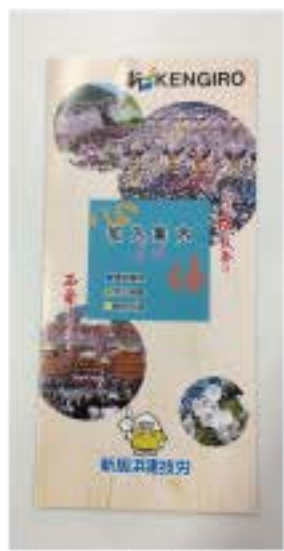
新しく作成したパンフ

また、確定申告会場については、レイアウトや運営方法が大幅に見直され、換気や消毒、距離確保などの対策や時間指定の整理券配布し、安心して相談できる環境整備が進められています。3月16日以降は、会場によっては相談スペースの確保に制約が生じる可能性があるため注意が必要です。