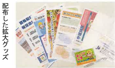
配布した拡大グッズ

東西南北の4つのブロックに分かれて計画し、2、3人のグループに分かれてポスティングを行いました。