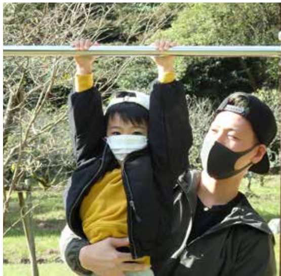
家族で参加し皆で楽しみながら健康づくり

「働き方改革関連法」は、2019年4月から順次施行されており、労働者を雇う事業主には、労働時間の記録・管理をはじめ、関係書類の整備、割増賃金の支払い、有給休暇の取得義務など、適切な対応が求められます。また建設業には「時間外労働の上限規制」の適用に5年間の猶予が設けられていますが、2024年4月からは全面適用となり、多職種と同様に時間外労働の上限が原則「月45時間・年360時間」となります。 全建総連では、働き方改革関連法に対し、仲間の理解を促すことを目的に、「働き方改革への