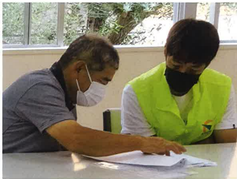
地図を見て訪問ルートの打合せをする松山支部

渡しやすいノベルティにすることで、気軽に誰にでも組合の事を紹介しやすくなるのではないかと思います。誰でも使えて、貰っても困らない物なので、これからの組織拡大行動や日々の業務の中で色々と活用していきたいと思っております。