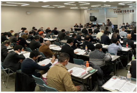
全国の仲間が集まる

交付申請は3月下旬から始まる予定です。申請前にインターネットでの事業者登録が必要ですが、これまでもより簡易になる予定です。制度をお客さんに知らせ、仕事確保につなげましょう。