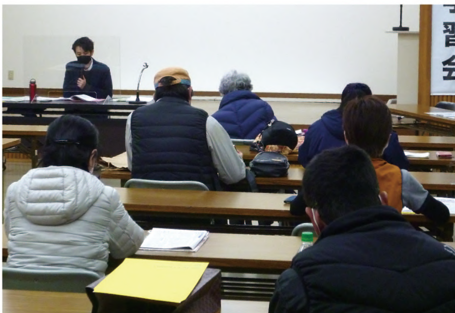
22人の組合員さんが参加し開催した税金学習会