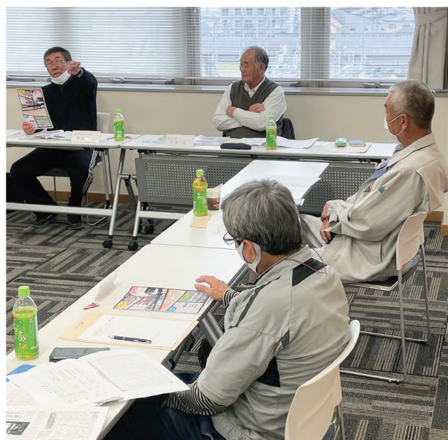
久しぶりに顔を合わせ意見を交換し合う