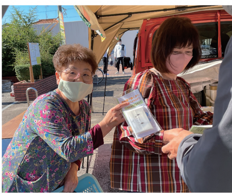
イベント会場でチラシを手渡す（北条支部）

【組織対策部】令和4年度は1年間に407人の仲間が新たに加わりました。昨年度に続き3年連続での年間減勢となりま