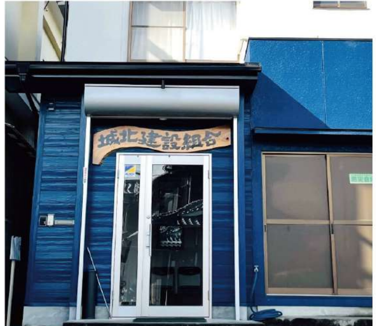
樹齢1000年以上のケヤキで作成された看板を掲げる事務所

組合発足時は自宅で役員会 発足当初より長年にわたり先輩の皆様の努力と行動に深く感謝しています。20年程前のピーク時には組合員400名に手が届く勢いでしたが、現在は300名回復に向けて少ない役員で組合員皆様と共に頑張っています。余談ですが、写真の中の「城北建設組合」の看板ですが、10年くらい前に熊野の奥深い山中に千年以上立っているケヤキの枝をいただきました。書家に少し右肩上がりに書いてもらい、組合も末永く右肩上がりに発展する事を願い作成しました。私も組合に入り44年になり、第15代組合長としても組合員さんに不利・不便が生じないように役員で頑張っています。