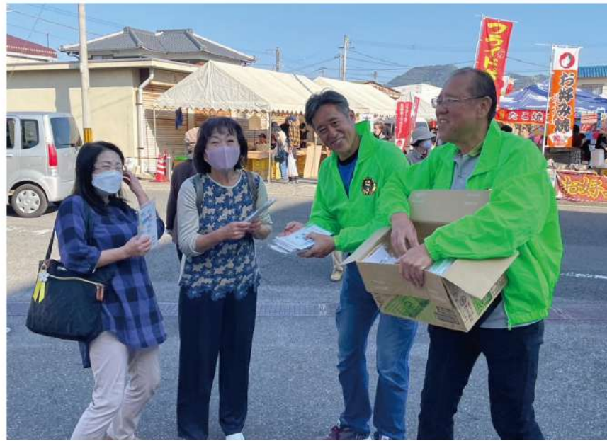
人気ブースに並ぶ待ち時間を利用して交流を図り組合を紹介

も木工教室等の出店を行 い、文化祭来場者にチラ シやポケットティッシュ、 パンフレットなど250 部を手渡しました。 人が多く集まる人気