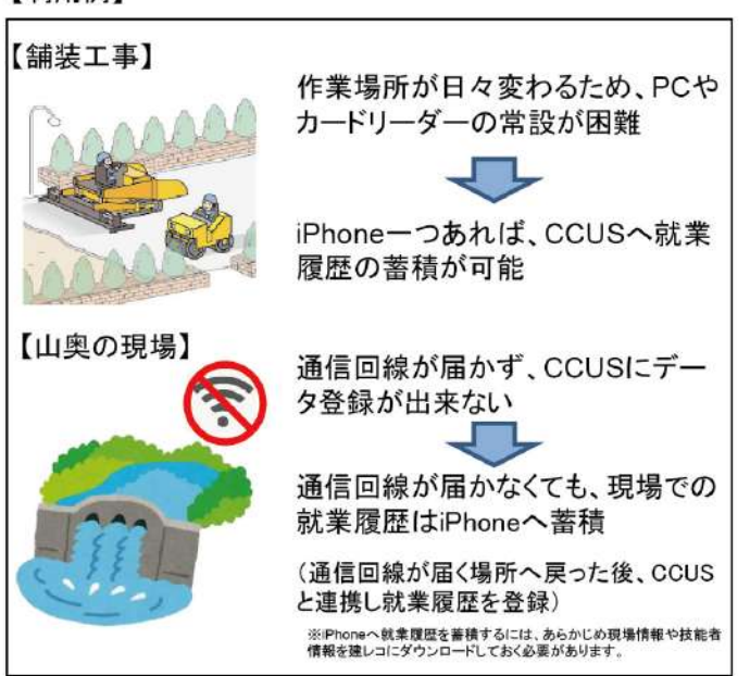
iPhoneのカードリーダー化(CCUSHPより)

【対象環境】 ・iOS16以上のiPhone ※建レコ対応のiOSに準じる (iOS16へアップデート可能な機種は、iPhone8以降及びiPhoneSE第2世代以降) ・建レコver 1.2.10以上 ※AppStoreからインストールしてください 【留意事項】 ・今回新たに提供するiPhoneのカードリーダー化は、CCUSカードの暗号化されていない領域を利用して就業履歴を蓄積するため、これまでと比べ偽造防止のセキュリティレベルは低くなっています。ご利用に当たっては、その旨ご承知おき下さい。