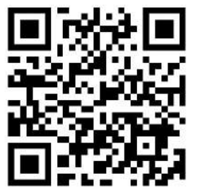
詳細はQRコードより

2024年1月29日から建設キャリアアップシステム(CCUS)の就業履歴の蓄積にiPhoneがカードリーダーとして使用できるようになりました。 従来は専用のカードリーダーやPC等が必要でしたが、建レコがインストールされたiPhoneで就業履歴として現場の入退場が可能となります。 通信回線が届かない場合でも、現場での就業履歴はiPhoneへの蓄積が可能です。通信回線が届く場所へ戻った後、CCUSと連携し就業履歴が登録されます。 利用にあたっては、建レコのインストールとiPhone8以降およびiPhoneSE第2世代以降のスマホが必要となります。 就業履歴蓄積画面までの手順イメージについては右記のQRコードを読み取りご確認ください。なお、現在の所Android端末では利用できませんのでご注意ください。