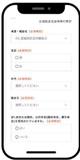
Web回答の組合は43愛媛建労を選択

この調査は全建総連が主導で行い、前回実施した2019年調査では「受給額が少ない」「不安を抱いている」「制度がわかりにくい」「あきらめている(あてにしていけない)」などの不安や不満の声が多く寄せられました。皆さんの実態を把握し、年金制度の拡充、運動の強化につなげていきます。調査へご理解いただき、協力をよろしくお願いします。