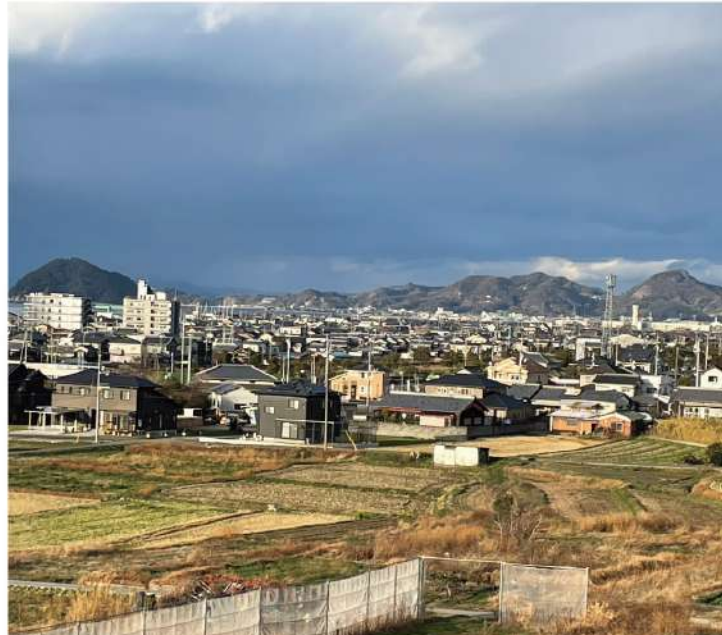
左の山が鹿島、右の山が腰折山

POINT これからが楽しみな組合 北条支部は、2005年(平成17年)に市町村合併で松山市になり ましたが、旧北条市内で活動し、母体組合は北条市建築総合協同組合と未だに「北条市」の名を残しています。当時の北条市役所近く、昭和38年会館を新築致しました。しかし、長年行事等の活用で傷みもあり、数年前から建物の屋根修理、天井張替と修繕しています。当時の役員さんや組合員さん感謝しつつ次世代に繋いでいきたいと思っています。 旧北条市には、高縄山や北条鹿島と自然に恵まれています。昔聞いた話によると「ある時、隣同士にあった鹿島と山が喧嘩(お相撲?)して鹿島は海に投げられた。山は鹿島 を持ち上げたとき腰の骨が折れて腰折山と呼ばれるようになった」国道196号線を松山から北へ車を走らせる と文化の森あたりから見えますが、確かに腰が折れたような形をした山です。 北条支部は、支部の中では少人数の組合です。しかし、最近では若い人の加入も増え、行事の参加者も若返ったように思います。先日、海道来島大橋サイクリングに妻と参加しましたが、子どもさんを含めての家族連れが多いのに驚きました。若いお父さんは、家族を連れての行事に参加してくれる傾向にあるようで、これからが楽しみです。