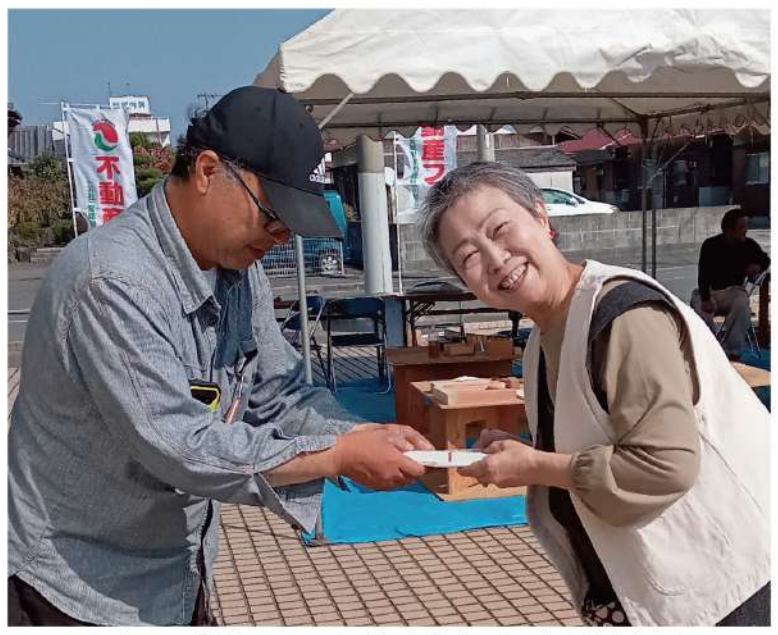
イベント会場でチラシを手渡す(西条周桑支部)