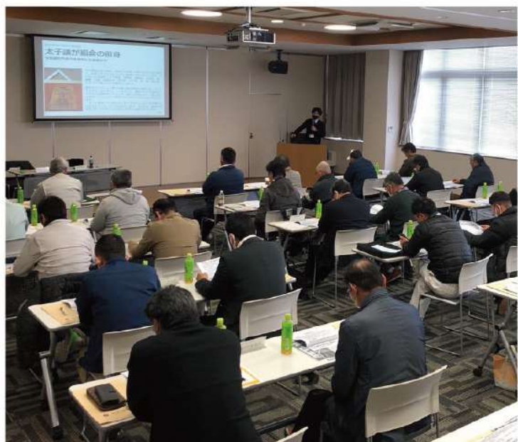
全建総連長谷部賃対部長より賃金運動の歴史含めて講演