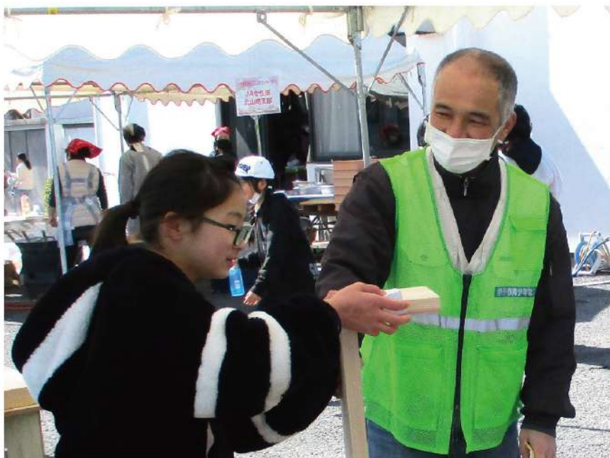
支えられながら紙やすりで面取りをする体験者