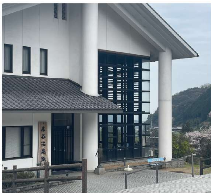
風呂上りの景観に心落ち着く伊予の三湯「本谷温泉」