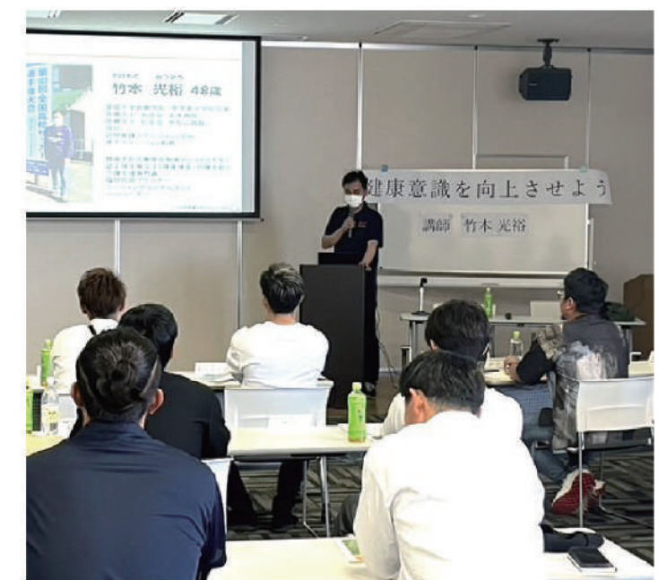
総会後の交流企画として実施した健康意識向上の講話