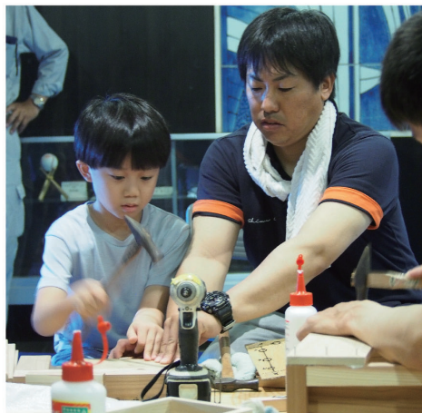
隅田青年部幹事に支えられ釘を打つ参加者