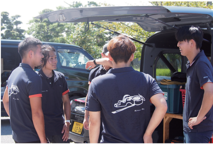
表彰式と閉会式を終えてお互いをたえ合う選手5人

【教宣部】全建総連第40回全国青年技能競技が愛媛県武道館で9月14日から16日にかけて開催され、表彰式と閉会式を終えた選手に、練習や本番を終え、振り返ってみての気持ちなどを教えていただきました。