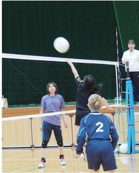
決勝戦で昨年のリベンジを果たすべく挑戦した松山北Aチーム(右)と王者北条Aチーム

※ブロック内で同得点の場合は直接対決の勝敗による ※印は決勝トーナメント進出チーム