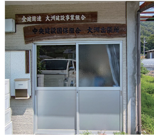
豪雨により氾濫被害を受けた大洲支部事務所

災害支援を受けた大洲支部だからこそ県内外の支部の皆様との結びつきを強く感じています。災害はいつ襲ってくるかわかりません。その為にも、日頃より各支部や各組合員との絆を深めつつ大洲での支部活動をしていかなければならいと深く考えています。