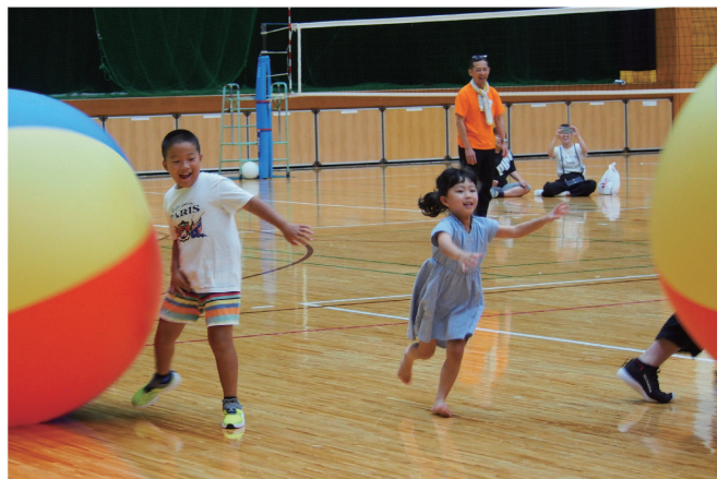
デカパンレース最終走者は大玉転がしでコースを駆け抜け、ほぼ同時にゴール。会場の観客を沸かせた。